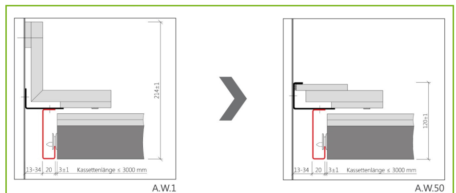
Vergleich Standardanschluss FURAL ALT – NEU

So wurde die Gesamthöhe der Anschlüsse nochmals verringert wie beispielsweise beim zentralen Anschluss A.W.50 von 214 auf 120 mm. Diese Anschlussvariante bietet zudem